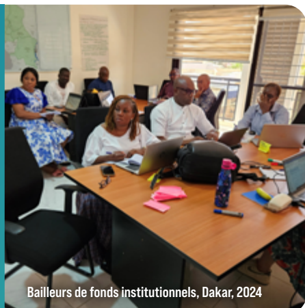
Bailleurs de fonds institutionnels, Dakar, 2024