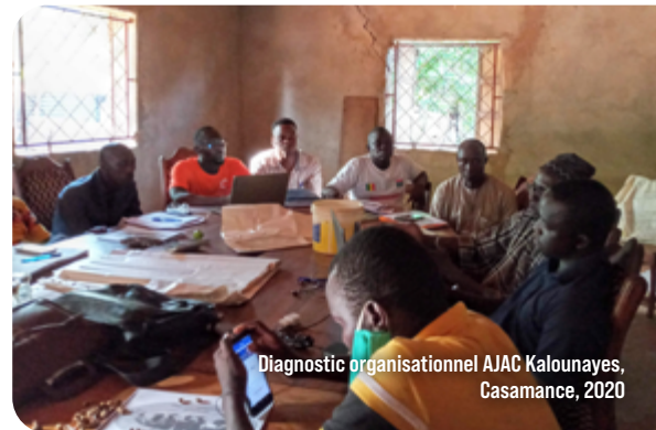
Diagnostic organisationnel AJAC Kalounayes, Casamance, 2020

participante Formation Partenariats, (octobre 2023)