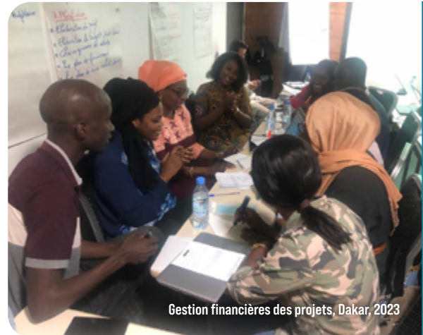
Gestion financières des projets, Dakar, 2023